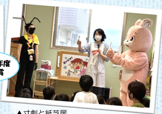
▲寸劇と紙芝居 ～「歯と口の健康週間」事業 幼稚園・保育園啓発活動

◀▲歯に関する話をパペット を用いて説明した動画 「モーバとラッシーの 歯（ハ）ッピータイム」 千葉県茂原市保健センター